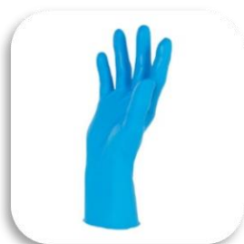
GUANTI MONOUSO IN LATTICE O NITRILE