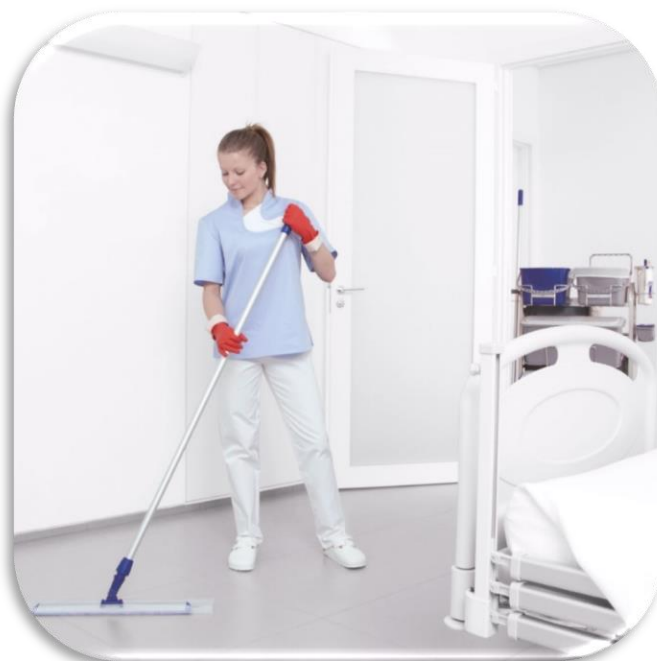
ATTREZZATURA PER LAVAGGIO PAVIMENTI