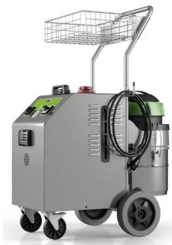
MACCHINA SANIFICAZIONE A VAPORE