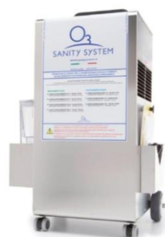
MACCHINA SANIFICAZIONE AD OZONO